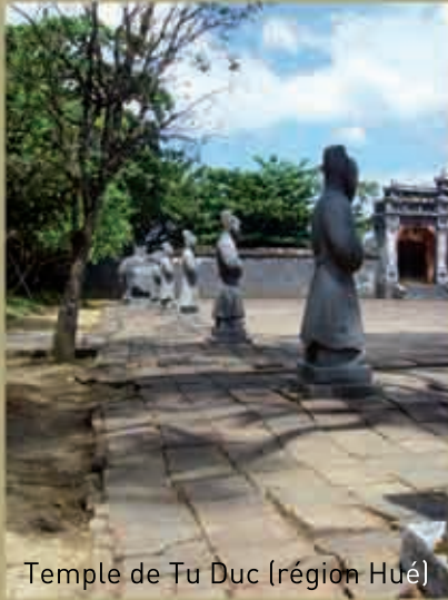
Temple de Tu Duc (région Hué)

Un autre thé au choix, fromage blanc 2 marmelades maison un petit pain Un greenie cacahuètes et matcha