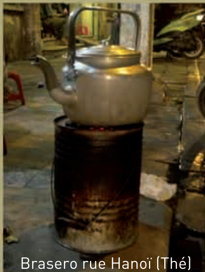
Brasero rue Hanoï (Thé)