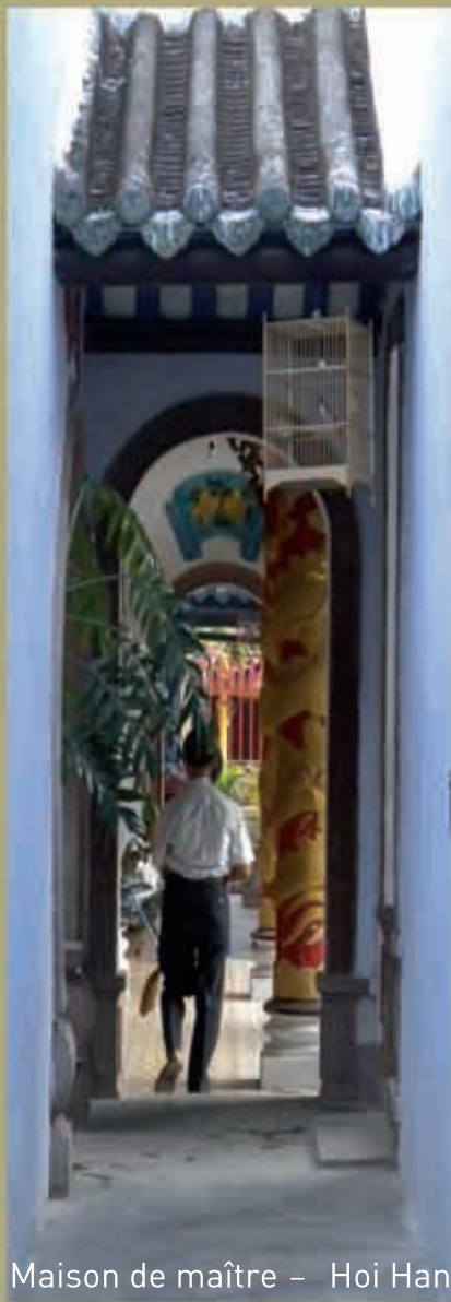
Maison de maître – Hoi Han