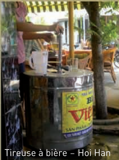
Tireuse à bière – Hoi Han

Ché à la banane fraîche (perles du japon et crème coco) et cookie croquant aux cacahuètes Eau minérale 33cl