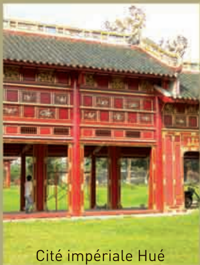
Cité impériale Hué